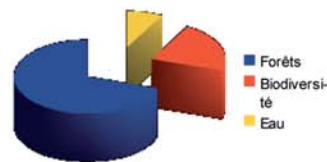
Principaux sujets abordés pour le thème des milieux naturels.

La richesse paysagère du territoire est sans cesse sous-entendue lors des débats. Cela se confirme lorsque l'on discute du milieu naturel en garrigue. 70 % de la discussion revient au vaste sujet de la forêt. Pour une partie de la population, la forêt symbolise un paysage idéalisé, un cadre de vie agréable... Pour d'autres, l'extension forestière sous-entend un abandon agricole, un risque accru d'incendie, une perte de biodiversité et une diminution du caractère méditerranéen des paysages et milieux naturels.