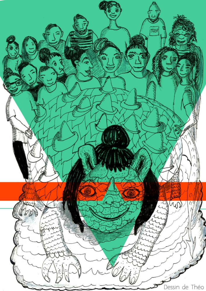
Dessin de Théo Depréneuf