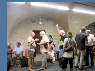
Rencontre des membres du Collectif à Sommières, le 15 septembre 2011.

Largement diffusée, elle fait connaître les actions du Collectif.