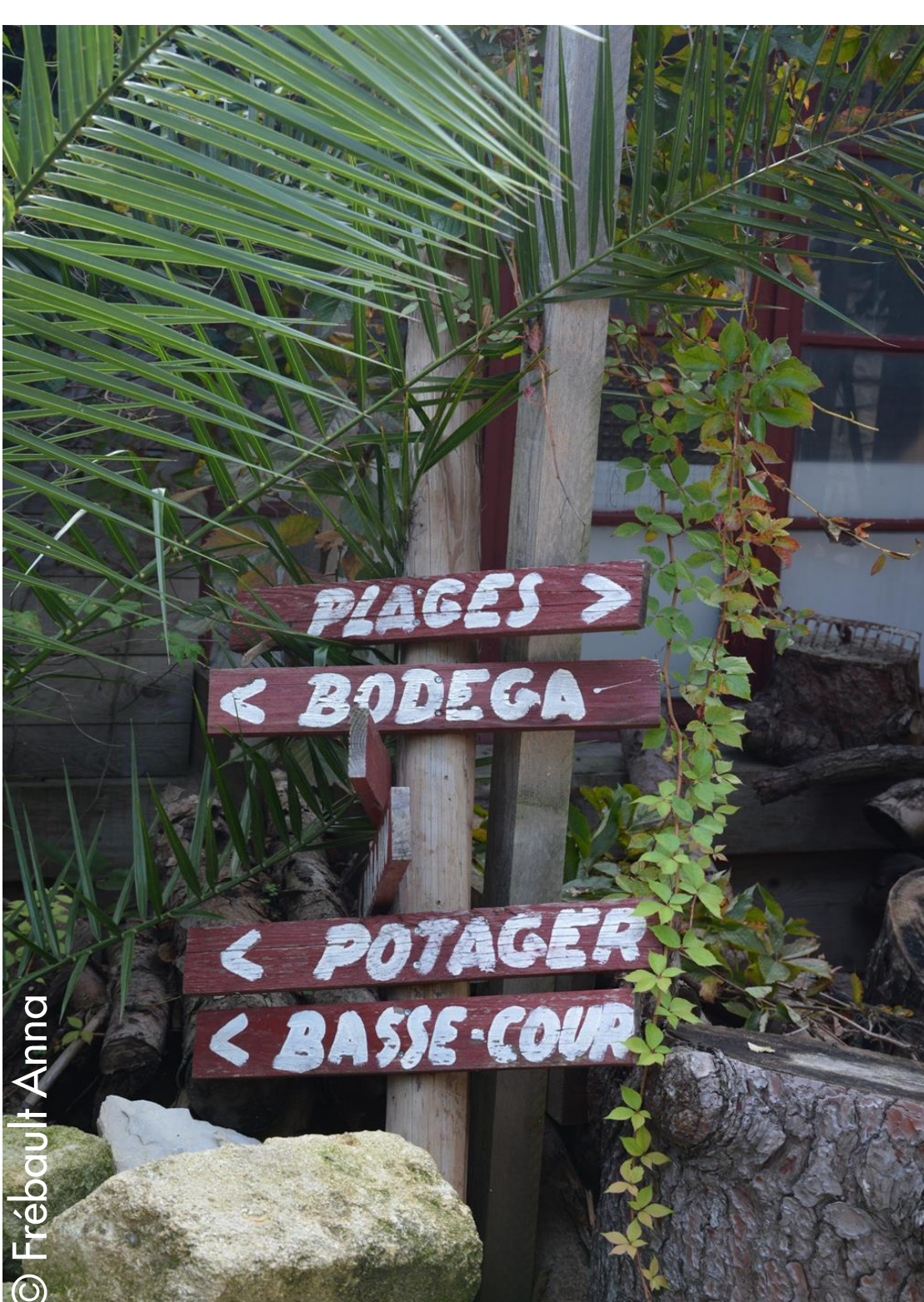
Activités proposées au sein de la structure