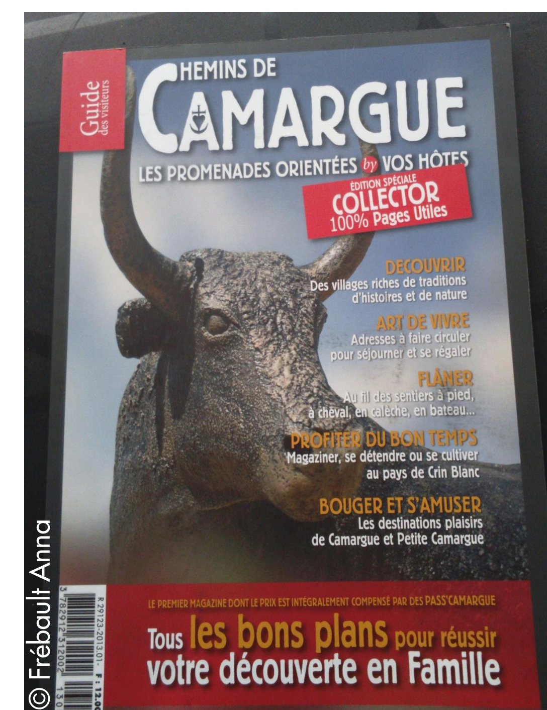
Magazine "Chemins de Camargue"