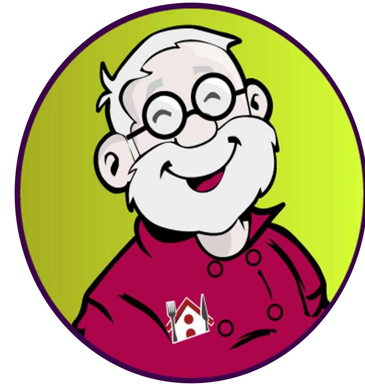
Nouvelle mascotte de l'auberge