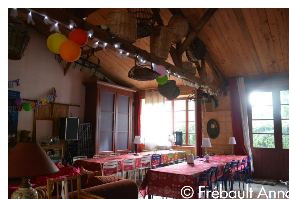
Entrée principale, salle de séjour et salle de restauration de La Table à Rallonge