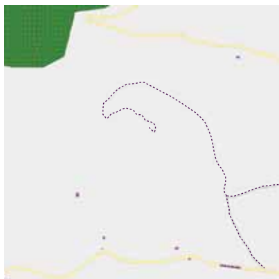
Carte Serre de Mouressipe avant la cartopartie

Toute une réflexion a alors été menée pour décider des termes appropriés pour renseigner ces données (un système de mots clés et de valeurs, propre à OpenStreetMap) afin d'harmoniser la saisie du petit patrimoine des garrigues dans cette carte mondiale.