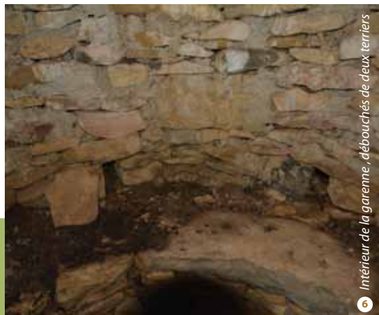
Intérieur de la garenne, débouchés de deux terriers

En fin de balade, le sentier passe à proximité d'habitats gallo-romain ayant fait l'objet de fouilles : des puits et les restes d'une voie romaine pavée de moellons posés en chant ont été trouvés. Il est possible de voir une partie de dolium dans le hall de la Mairie de Saint-Côme.