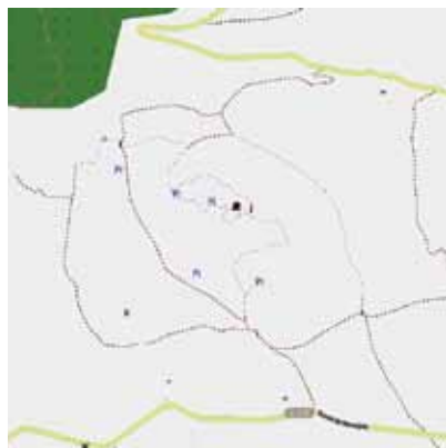
Carte Serre de Mouressipe après la cartopartie