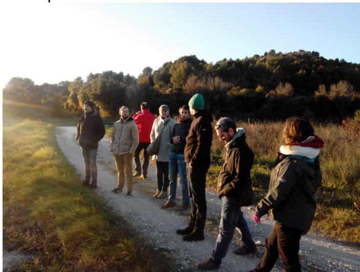
Visite en garrigue à St-Come et Maruejols en amont de la rencontre

Cadre formel : le projet qu'on développe ici doit être fait en pleine osmose les objectifs des différents cadres et objectifs des GALs. Le lien entre le projet et les stratégies de chaque GAL doit être transparent.