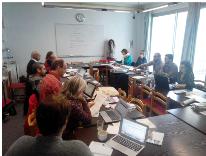
Séance de travail sur la coopération du mercredi matin